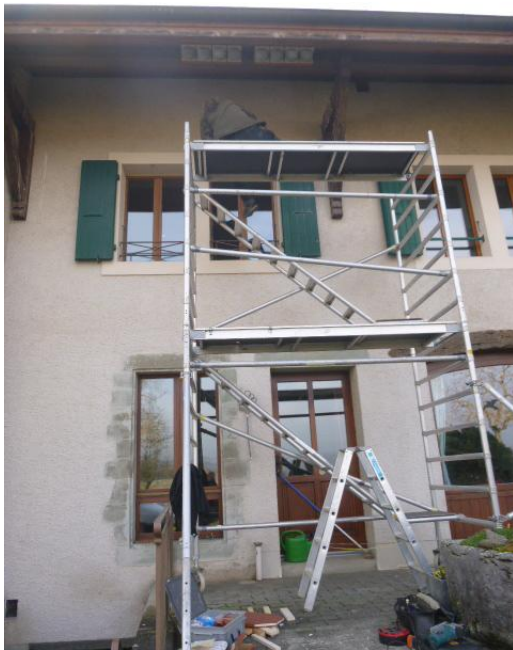
Fig. 4 : Installation de 8 nids artificiels à Athenaz en février 2018, à l'aide d'un échafaudage.