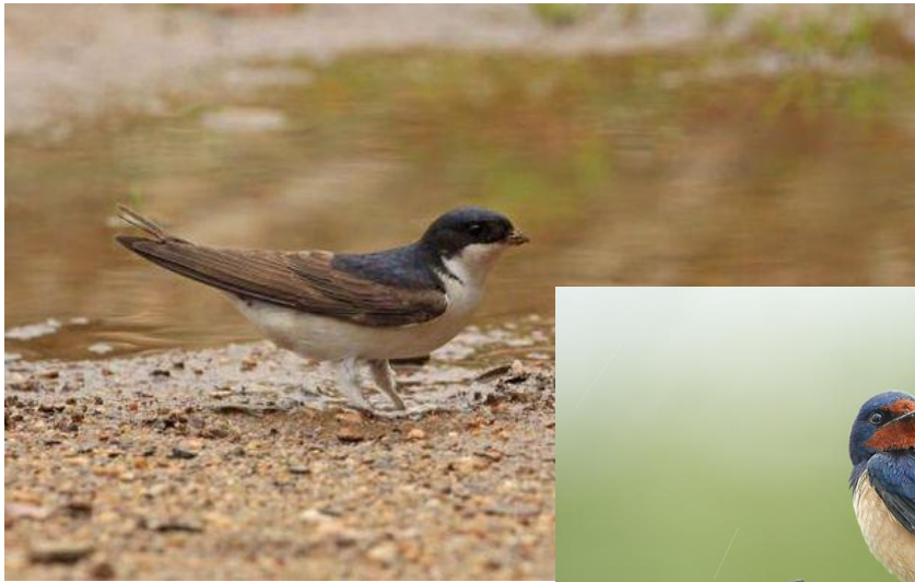
Hirondelle de fenêtre