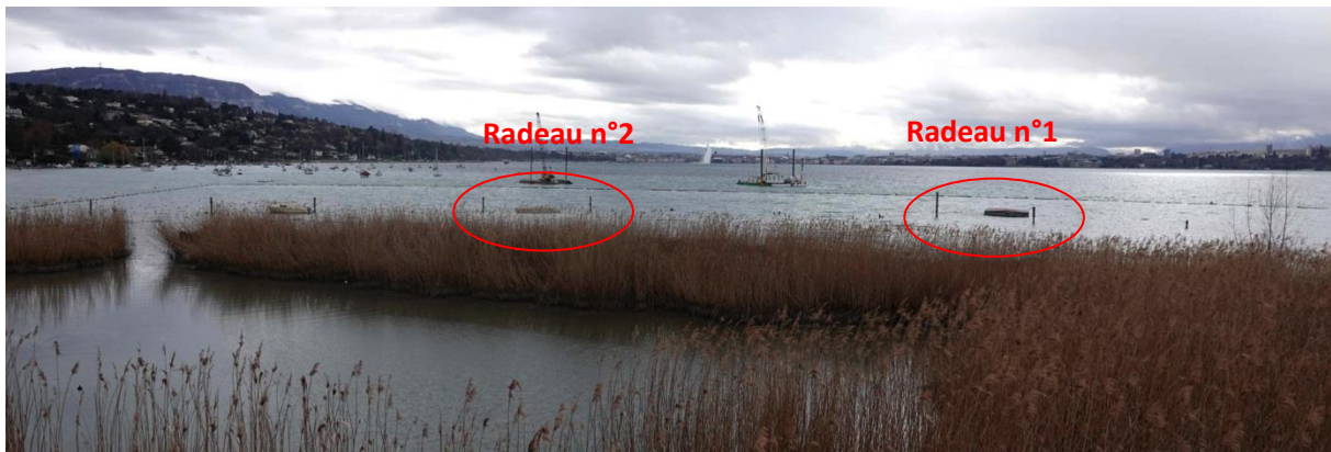
Figure 1 : Emplacement des radeaux à la Pointe à la Bise, vus depuis la tour d'observation